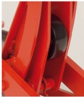
La rueda interior en los modelos T2X y T1.5H facilita una excelente maniobrabilidad.