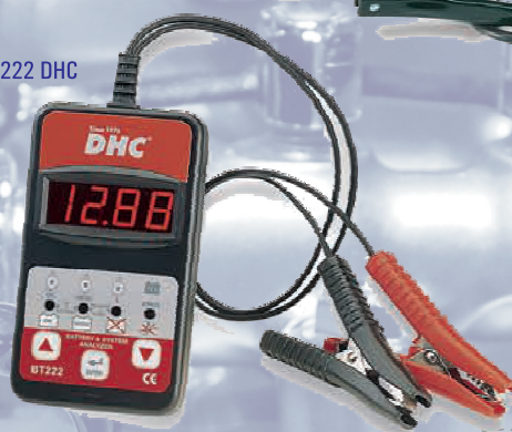
BT 222 DHC