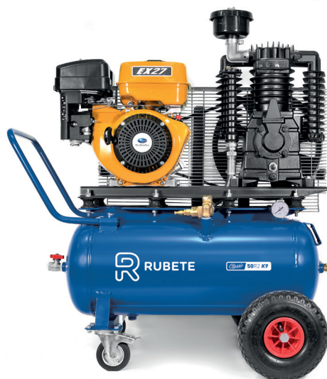
CLASSIC 50R2 K9