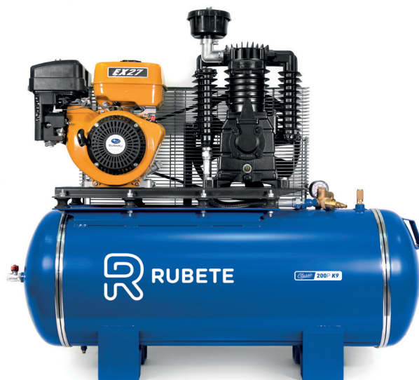
CLASSIC 200P K9