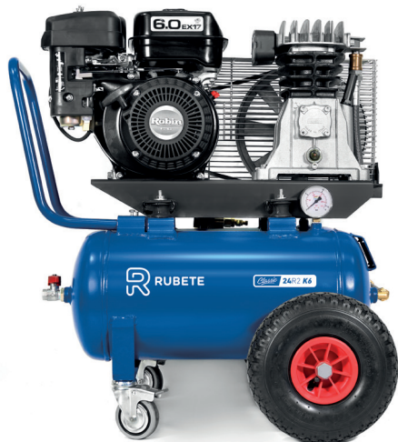
CLASSIC 24R2 K6